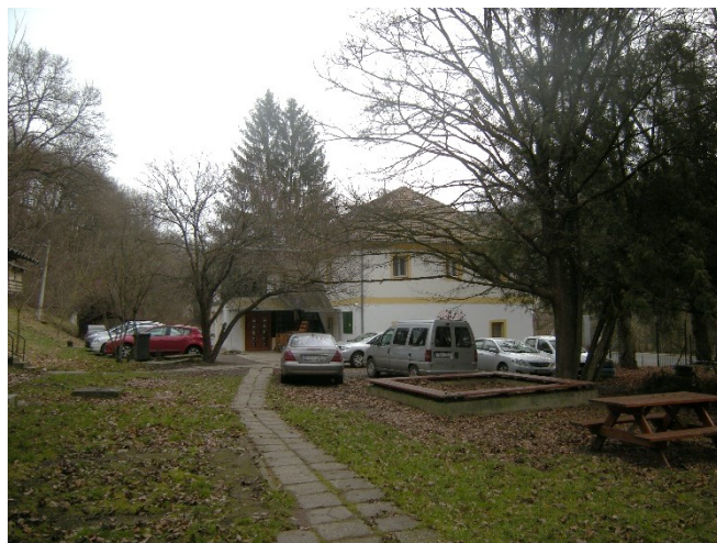
A nyári tábor helyszíne Kismaroson: júl. 16-21

„Rengeteg szeretetet kaptam Tőletek, amiért nagyon hálás vagyok. Bármilyen problémámmal fordulhatok hozzátok, hiszen mindig készek vagytok segíteni. Mindig van min nevetnünk...”