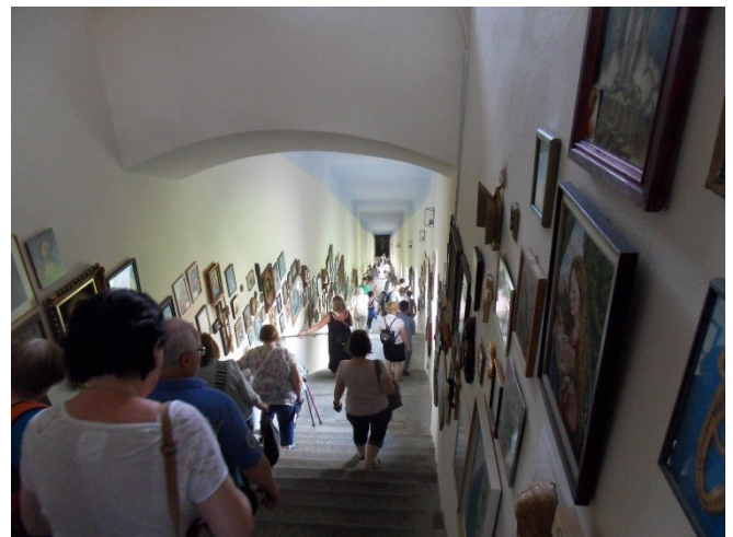
Passau-Mariahilf: a zarándok lépcső

392 fokú fedett lépcsősor vezet fel a városból, sok-sok fogadalmi képpel, hálatáblával szegélyezve. Természetesen nem hagytuk ki városi sétánkából Niedernburgot, a kolostort, ahol Szent István királyunk felesége boldog Gizella nyugszik. Sírja előtt leróttuk kegyeletünket. imádkoztunk, himnusz énekeltünk, és kértük égi közbenjárását az itthon maradt betegjeinkért, családunkért.