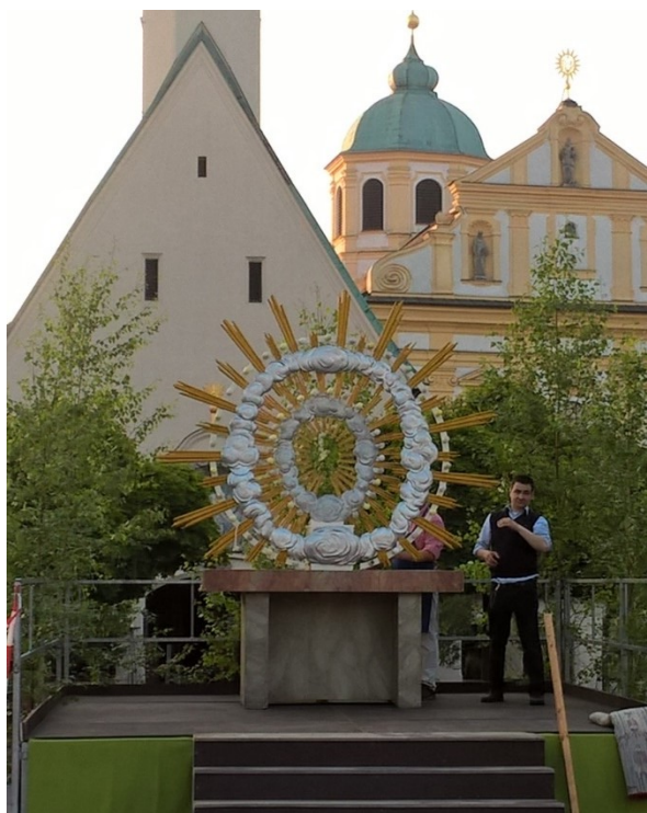
Csütörtök hajnali 6 óra: Úrnapi készület Altöttingben a kegykápolna előtt.