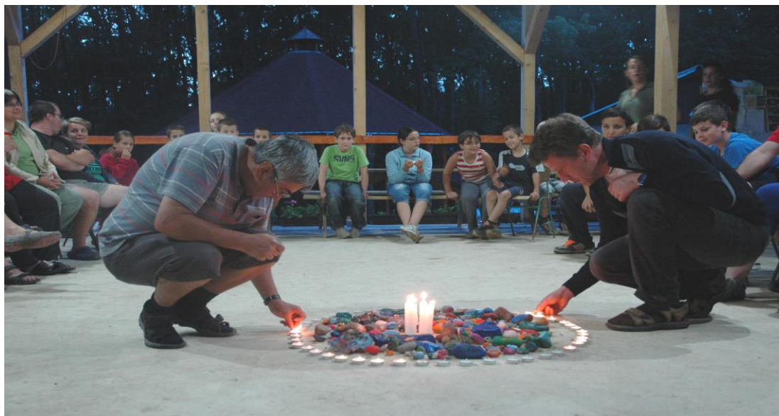
Záró tábor-tűz az „élő kövek” körül