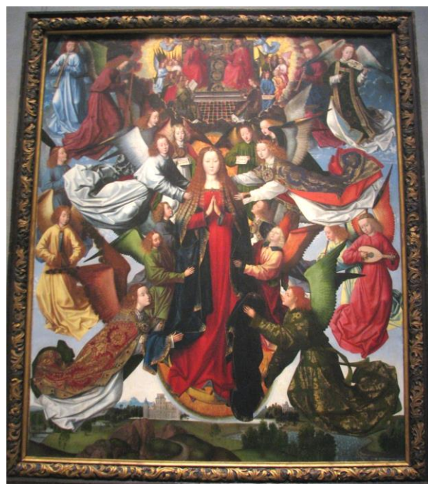
Szűz Mária Királynő:

bennem azok a tulajdonságok, amelyek Mária szolgálatát jellemzik?