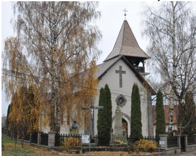
A kézdialmási Mennybemenetel templom

A fogadó családok már vártak minket, két-két fő került egy családhoz, mikor megérkeztünk a házakhoz, nemcsak az ajtók, de a szívek is kinyíltak. Olyan szeretettel fogadtak, mint a régi jó barátokat, rég nem látott családtagokat, a polgármester harsogó jókedvvel, zamatos pálinkával. finom gulyással. Reggel a nagymamánál töltött gyerekkori élményeket idézte a korai kakas kukorékolás, a friss levegő, a tehenek kihajtása, a frissen fejt tej illata és a kerülendő lepények az út mentén, ismerősként köszönt a velünk szembejövő.