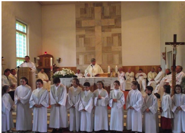
a búcsúi szentmise Kézdialmáson