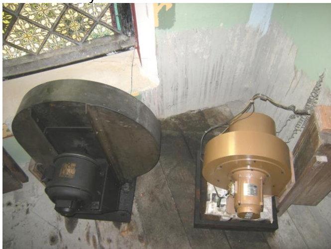
a régi és az új orgonamotor

nagy szerepet játszanak az orgona megszólaltatásában is felújításra kerültek. Már be van építve az új orgonamotor is. A motor magyar gyártmány, egy győri vállalkozás gyártja, és igazoltan 10 év gyártói garanciát vállal. A Művészetek Palotája nagy orgonáját is ilyen motor látja el. Ez az új motor nem csak tömegében kisebb, de jóval halkabb működésre is képes, és hatékonyabban is generálja a levegőt a hangszer megszólaltatásához. Összességében azt lehet mondani, hogy ami munka elő volt irányozva az orgona szekrényben, az nagyjából, néhány apróságot leszámítva, elkészült. A sípok javítása és helyszínre szállítása folyamatosan történik.