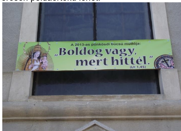
A csíksomlyói búcsú ez évi jelmondata

azaz hogy valami folytán itt jobban éreztem szeretetüket, mint itt a fővárosban általában érezhet az ember! Egységes és őszinte volt a szeretetük, mindenre kiterjedő! Nem gondolkodtak azon, hogy mit, mennyit, és hogy az megéri e ! Talán ez az őszinteséges szeretet még egy kicsit túlzottnak is tűnt! Persze kérdés, hogy a szeretet mélységét őszinteségét, lehet-e bármilyen esetben túlzottnak találni!? Az összetartozásuk, a magyarságuk az összefogásuk erejét éreztem ezekben az emberekben, kik az anyaországbelieknek is erősen példaértékű lehet!