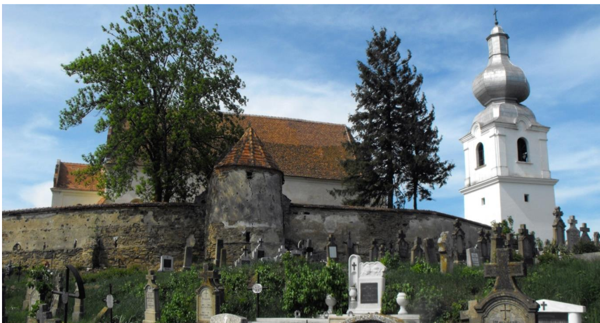
Kézdiálmás régi erőd temploma a Szent Mihály templom, a falu határában